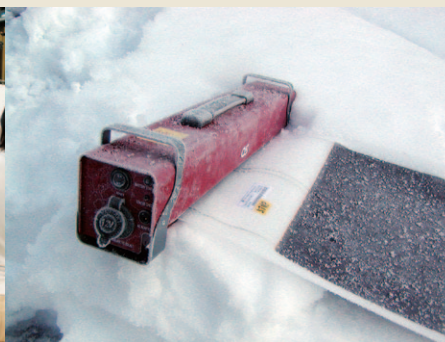
モバイルソーラー耐久テスト