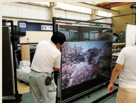
大型リアプロジェクションフィルム

商品化となるモバイルソーラーユニットの生産・発売を開始しました。オーエスエムは、お客様のご意見・ご要望を積極的に取り入れた自社商品開発に取り組んでまいります。また、お客様の委託生産や商品開発のお手伝いにも対応してまいります。