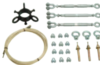
FK-02 振止め強化キット