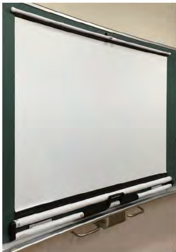
曲面黑板にもぴったり貼れるフレキシブルな幕面