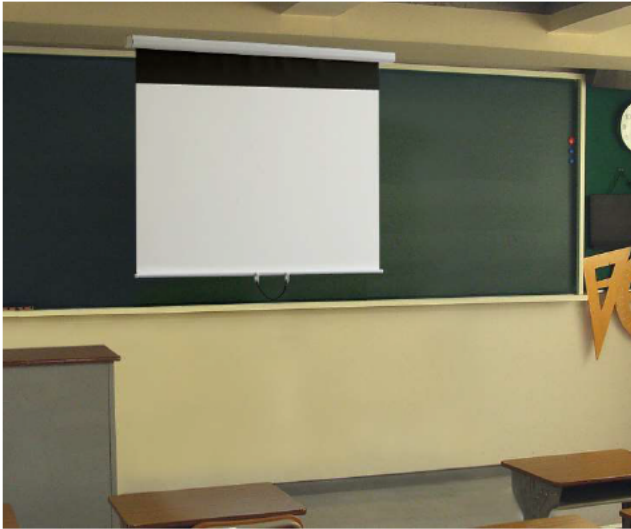
【写真】 WSM-068F-FV2-3 (レール無)

黒板に全面密着する安定感と平面性。 ソフトウインドとボールストップ機構を 備えたマグネット式スクリーン。