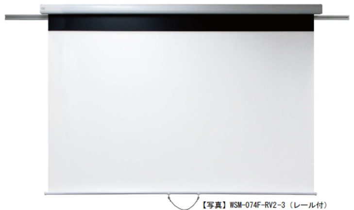
【写真】 WSM-074F-RV2-3 (レール付)