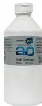
ハイコントラスト 0.85 ライトグレー