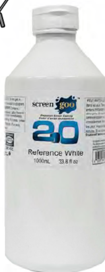
リファレンスホワイト 1.0