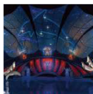
プロジェクションマッピング