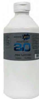
マックスコントラスト 0.70 ミディアムグレー